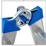
Articulation automatique acier ultra résistante

Echelle multifonctions télescopique - Verrouillage de l'articulation renforcée et automatique - Roulettes de déplacement