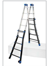
Utilisation en escalier