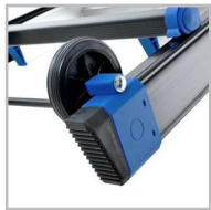
Roulettes de déplacement Patins bi-matières