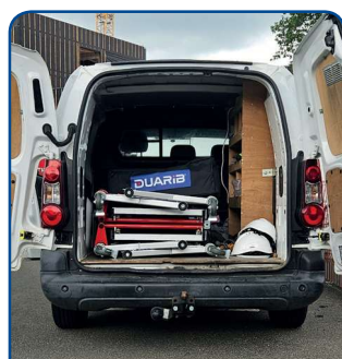
Des dimensions pliées réduites au maximum