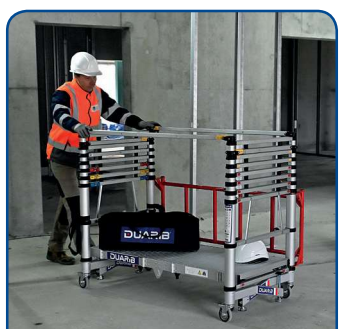
Utilisable en mode chariot