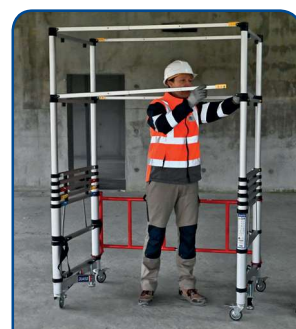
Montage express en sécurité depuis le sol, par un opérateur