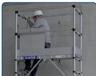
Passage de trappe élargi