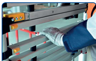
Système anti-pince-doigt perfectionné