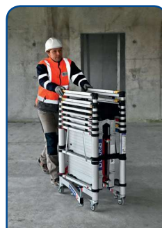
Structure, plancher et plinthes acheminés ensemble sur le chantier