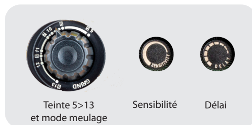
Teinte 5>13 et mode meulage